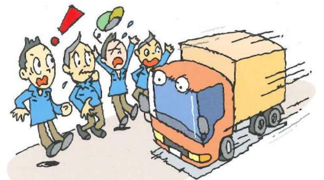
トラックが児童や園児のすぐ脇を走行して恐怖感を体験!

4月は、街中に新入学の児童や園児があふれています。その児童や園児の安全を守るような運転に心がけましょう。下のデータでもわかるように、生活道路を走行する時には、とくに夕方3時～6時の時間帯に注意して下さい。